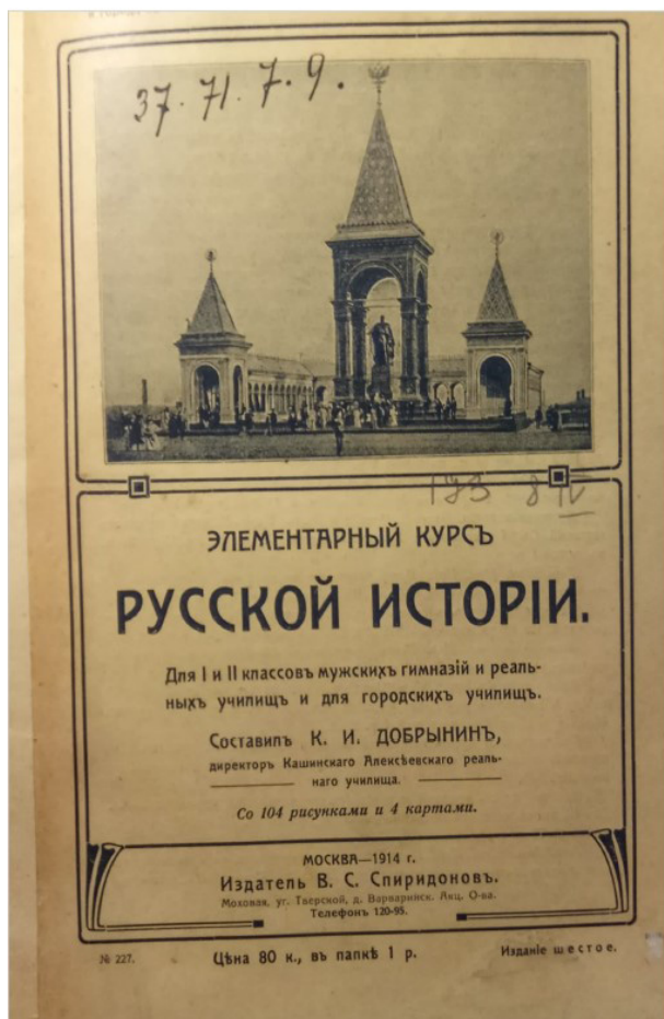
Рис. 2. Титульный лист учебника К. И. Добрынина «Элементарный курс русской истории». М., 1914

Подводя итоги, отмечу, что практики применения иллюстративного материала в дореволюционных учебниках по отечественной истории четко разделяются на два этапа: вторая половина XIX века (первые единичные опыты) и начало XX века (широкое распространение в младшей школе). Тем не менее в учебных руководствах его структура на протяжении всего изучаемого периода оставалась практически